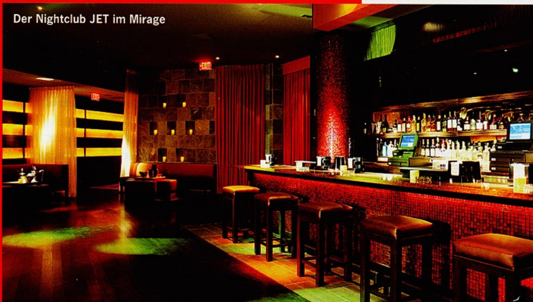
Der Nightclub JET im Mirage

E-Mail: info@ploner-partner.de , www.ploner-partner.de